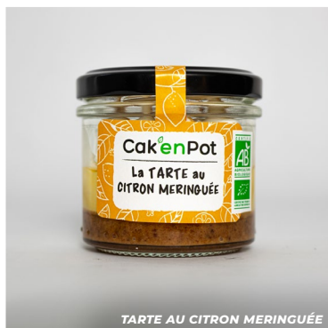
TARTE AU CITRON MERINGUÉE