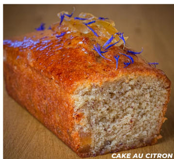
CAKE AU CITRON

Nos gâteaux de voyage S'EMPORTENT ET SE CONSERVENT FACILEMENT sans craindre les écarts de température.