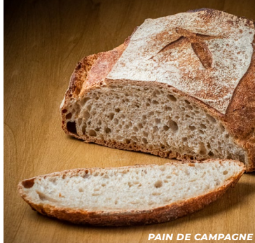
PAIN DE CAMPAGNE