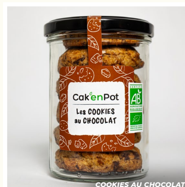
COOKIES AU CHOCOLAT