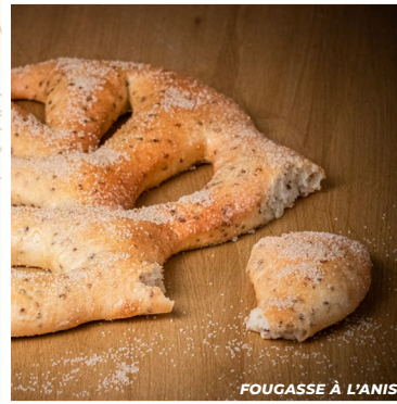
FOUGASSE À L'ANIS