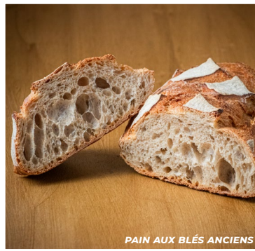
PAIN AUX BLÉS ANCIENS