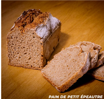
PAIN DE PETIT ÉPEAUTRE