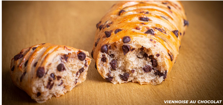
VIENNOISE AU CHOCOLAT

Autant que possible, les matières premières utilisées sont sélectionnées auprès de PRODUCTEURS LOCAUX (farine, œufs, lait...).