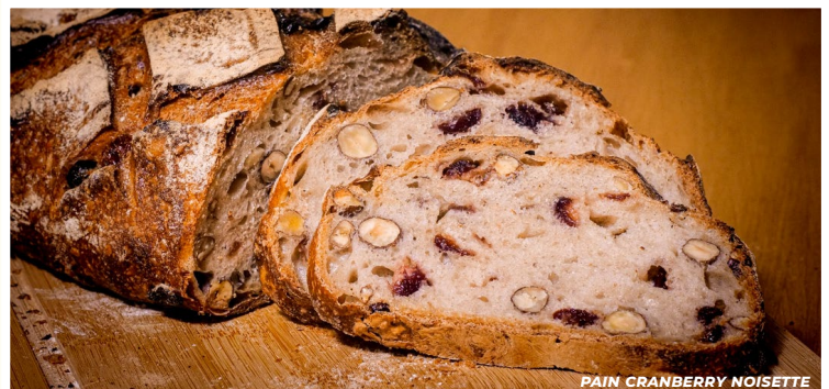
PAIN CRANBERRY NOISETTE