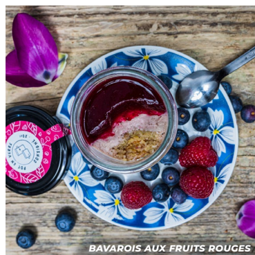
BAVAROIS AUX FRUITS ROUGES

Découvrez notre gamme innovante et ZÉRO DÉCHET de pâtisseries et de biscuits en bocaux réutilisables.