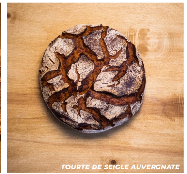
TOURTE DE SEIGLE AUVERGNATE