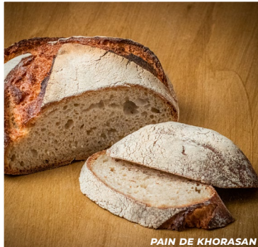
PAIN DE KHORASAN