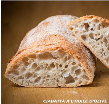
CIABATTA À L'HUILE D'OLIVE