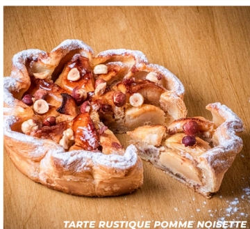
TARTE RUSTIQUE POMME NOISETTE