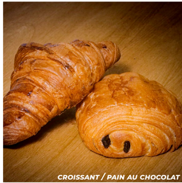
CROISSANT / PAIN AU CHOCOLAT