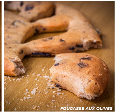
FOUGASSE AUX OLIVES